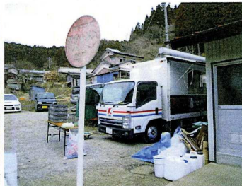
狭小な山間の集落にて公民館の軒先をお借りしました

一方、弊社グループ内の各地域では現地食材を用いた被災地応援メニューを販売するなど継続的な支援活動を行っています。