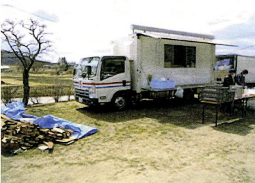
全壊集落を幾つも抜けた先にある小規模な避難所にて